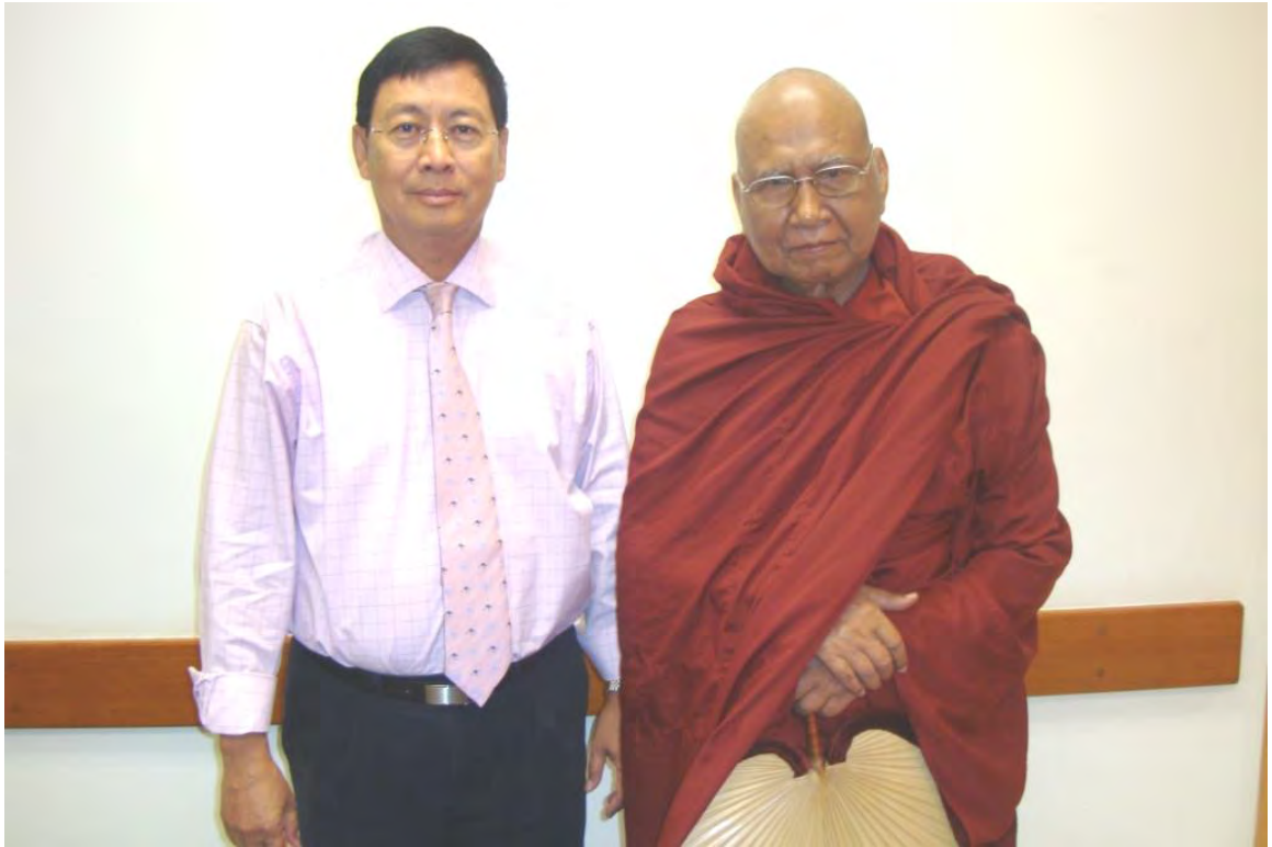
စာရေးသူနှင့် ဆရာတော်ကြီး (၂၆-၂၀၀၉)

ကင်ဆာရောဂါ (cancer) ဆိုတာ လူ့ခန္ဓာကိုယ်ထဲက ဆဲလ်တွေ မထိန်းနိုင် မသိမ်းနိုင် ပွားသွားပြီး နေရာအနှံ့အပြားကို ပျံ့ပွားတဲ့ ရောဂါပါ။ ကင်ဆာဆိုတာ လက်တင် (Latin) ဘာသာ စကားလုံး တစ်ခုပါ။ ကင်ဆာရဲ့ လက်တင်လို တကယ့်အဓိပ္ပါယ်ကတော့ ကဏန်းကောင်လို့ ဆိုလိုတာပါ။ အဲလို ဆိုရင် ကဏန်းကောင်လို့ အဓိပ္ပါယ်ရတဲ့ ကင်ဆာဆိုတဲ့စကားလုံးကို ဘာလို့ အလုံးတွေ အကျိတ်တွေ ဖြစ်တဲ့ ရောဂါအတွက် အမည်တပ်ပြီး ကင်ဆာရောဂါလို့ ခေါ်ရတာလဲဆိုတာ တွေးစရာပါ။ အဲလို ကင်ဆာလို့ ခေါ်တာကို ရှင်းပြပါမယ်။