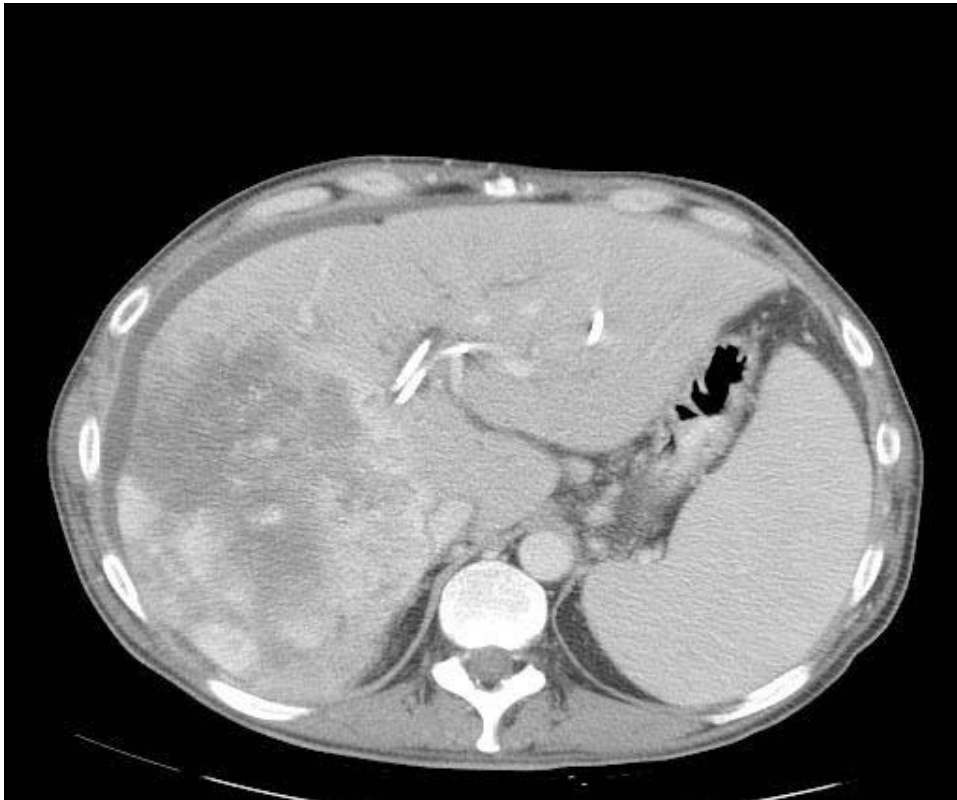
CT ဓါတ်မှန်မှာ တွေ့ရတဲ့ အသည်းထဲက ကင်ဆာအလုံးတွေ

ကျွန်တော်က အဲလို တင်ပြလိုက်တော့ အဲဒီ HBC အစည်းအဝေးမှာ လေ့လာကြတဲ့ အသည်းရောဂါ ပါရဂူအားလုံးက ဒီလူနာကတော့ မျှော်လင့်ချက်မရှိ၊ လမ်းဆုံးရောက်ပြီ၊ အများဆုံး နေရရင် (၆)လပဲလို့ သတ်မှတ်ဆုံးဖြတ်ကြပါတယ်။ ဒါပေမယ့်လည်း သူ့ရဲ့ကံပဲ (Chemotherapy) လို့ ခေါ်တဲ့ ကင်ဆာဆေးတွေသုံးပြီး ကုသကြည့်ချင်ရင် ကုသကြည့်ပေါ့လို့ အားလုံးက ဆုံးဖြတ် မှတ်ချက်ပေးကြတယ်။